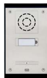
2N® Helios Uni