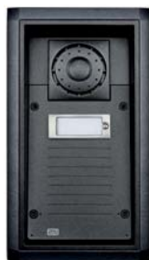
2N® Helios Force

Díky využití služeb stávající analogové ústředny šetří nejen náklady na nové řešení, ale nabízí i dokonalejší a širší služby, např. přesměrování v době nepřítomnosti (na jiné pracoviště, na záznamník, apod.) nebo přepojení hovoru (např. ze sekretariátu na požadovanou konkrétní osobu).