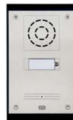
2N® Helios Uni