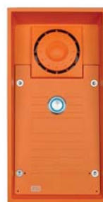
2N® Helios Safety