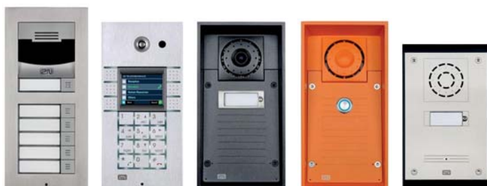
2N® Helios IP Verso 2N® Helios IP Vario 2N® Helios IP Force 2N® Helios IP Safety 2N® Helios IP Uni

Skupina 2N® Helios IP je portfolio dveřních interkomů do všech prostředí – ať už bezpečnostní, obchodní nebo nouzová komunikace do různých oblastí. Od jednoduchých aplikací vyžadujících jasnou a jednoduchou komunikaci na jediný IP telefon, až po komplexní komunikační řešení integrované do bezpečnostních a signalizačních systémů nebo IP ústředěn.